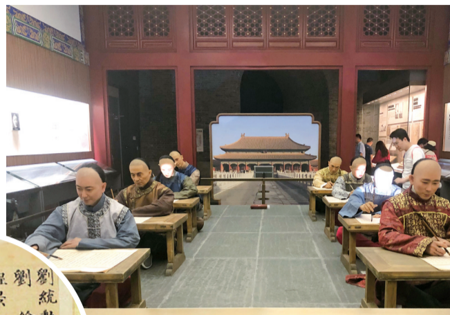
▲中国科举博物馆内清代殿试场景模拟图

放榜是最激动人心的时刻。殿试只进行排名,不再淘汰,均称进士。根据成绩不同分为三甲。第一甲三名赐“进士及第”——第一名称为“状元”、第二名称为“榜眼”、第三名称为“探花”;第二、三甲若干名,分别赐“进士出