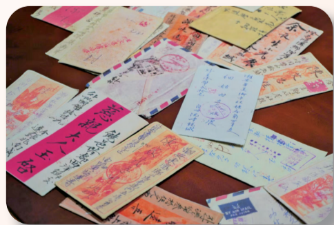
汕头市侨批文物馆内的侨批。