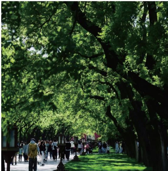
天坛公园古树下游人如织。

经历了600多年风雨，依然蓊(wēng)郁苍翠。走在它们的庇荫之下，人会不自觉地放慢步子。