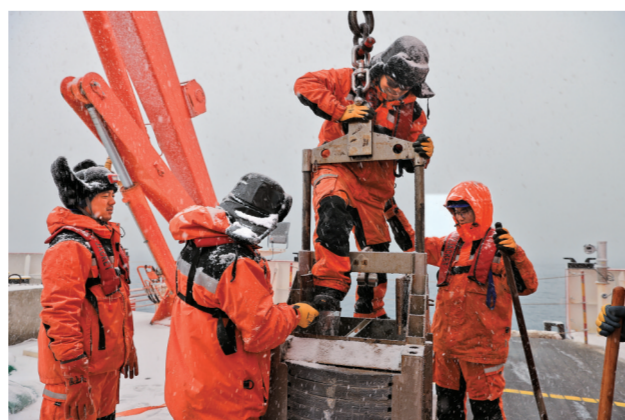
考察队员齐心协力获取海底沉积物样品。