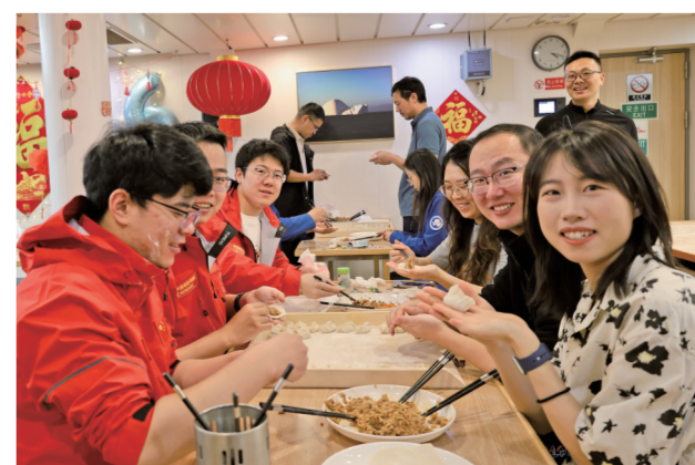
除夕,考察队员在“雪龙2”号上包饺子。