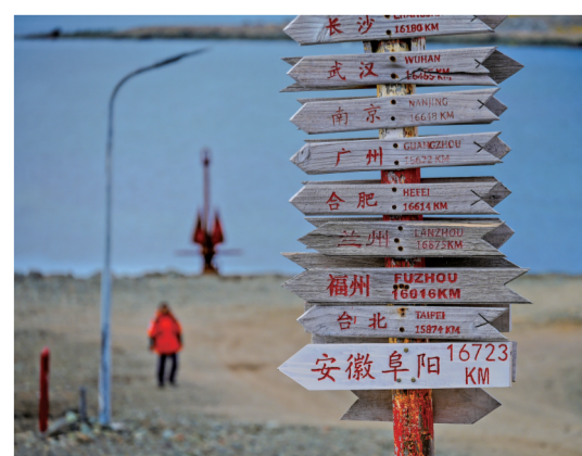
长城站的祖国部分城市方向标。