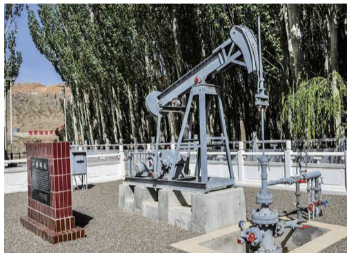
上图为《天工开物》中的“井火煮盐图”。