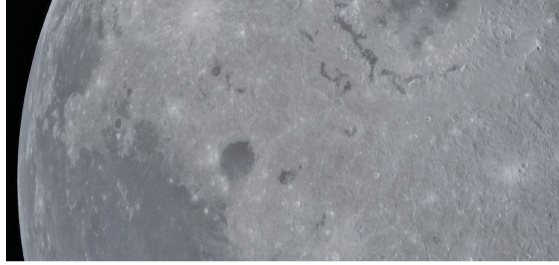
“猎户座”拍摄的太空影像。