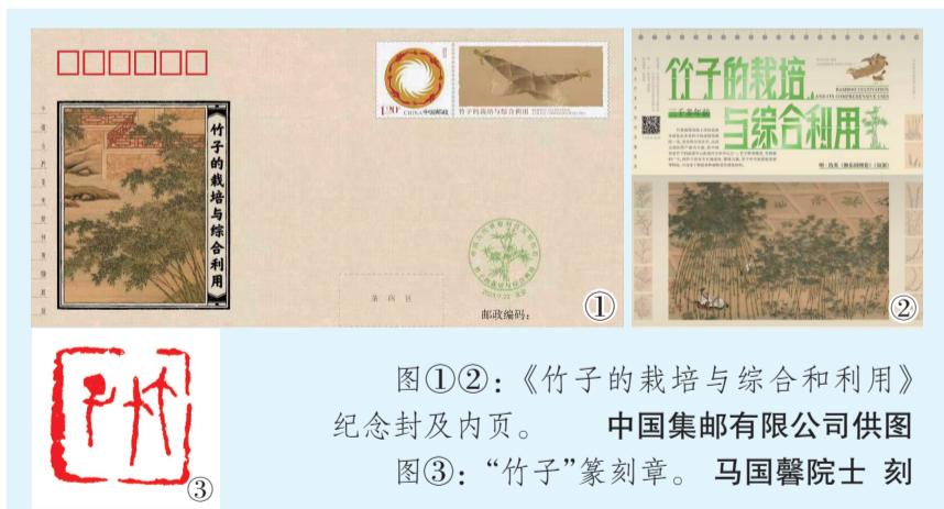
图①②:《竹子的栽培与综合利用》纪念封及内页。中国集邮有限公司供图