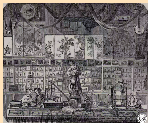
图①:赫德参观苏州织造局。