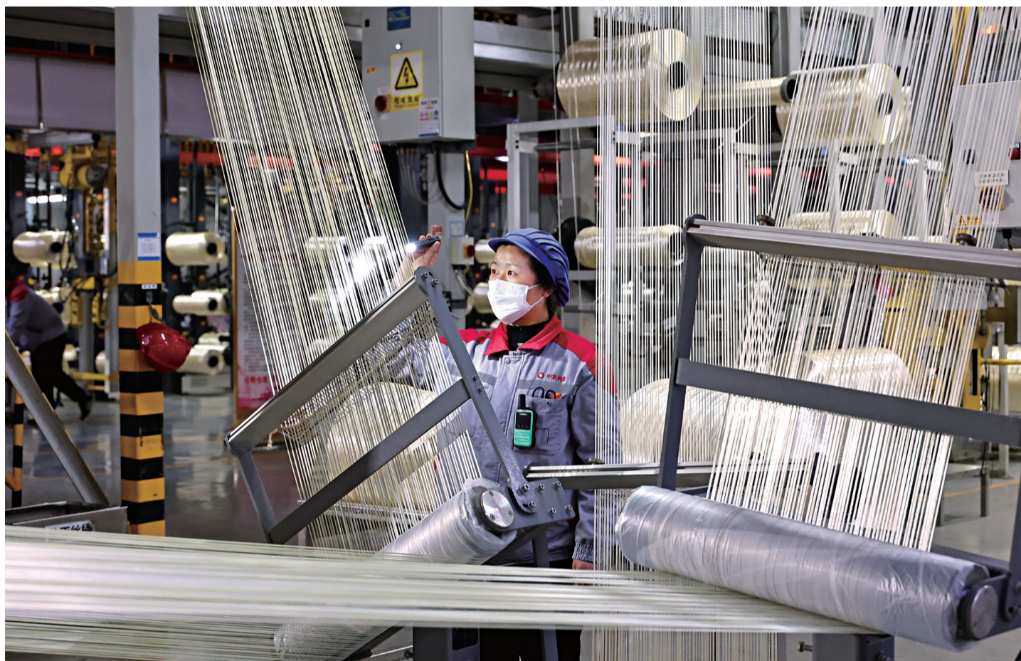
3月17日,工人正在碳纤维生产车间查看原丝丝道运行状况。

一根单丝直径几微米(相当于头发丝1/10)的碳纤维,其密度比普通钢材小,拉伸强度却是普通钢材的10倍。日前,由中国建材集团旗下中复神鹰自主研发的SYT80(T1200级)超高强度碳纤维,在江苏连云港正式下线量产,成为我国新材料自主创新的又一个里程碑。