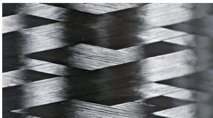
3月17日,刚刚下线的SYT80(T1200级)碳纤维局部特写,它的一束丝由12000根碳纤维组成。

根据科研人员拉力测算,一根手指粗的超强碳纤维,能吊起一架总重约80吨的大飞机。这根强劲的“中国丝”凭着超细、超轻、耐高温、抗腐蚀,强度高等优势,成为深海、深空等装备的重要材料。