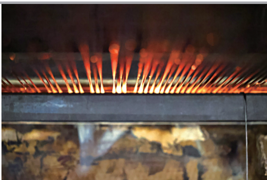
3月17日,生产线上的碳纤维在高温环境中逐步脱除非碳元素,实现结构优化。