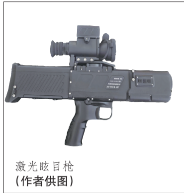
激光眩目枪

它的发射波长在几百纳米，当激光束射入人眼时，会在视网膜上形成一个过亮的光斑，强烈刺激感光细胞，导致目标瞬间眩晕、眼花，无法看清眼前事物。随着照射时间延长，激光甚至会导致更长时间的视觉功能丧失，并伴有短