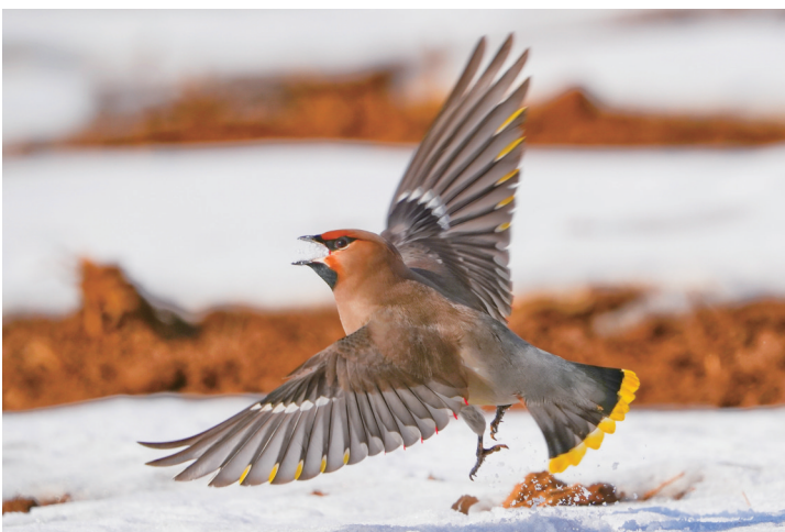
大太平鸟