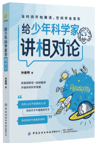
《给少年科学家讲相对论》,孙善明著,中国纺织出版社有限公司出版。

从稚子的发问开始,以知识的趣味为钥匙,打开理性认识世界的大门。书中涵盖了人类生理结构、行为模式的进化溯源,以及人类社会习惯与文化现象的生物学解释。它不高悬于学术神坛,而是行走于市井生活,将人类行为背后的生物逻辑娓娓道来,是一部真正“从身体出发,抵达生活真相”的轻学术读本。