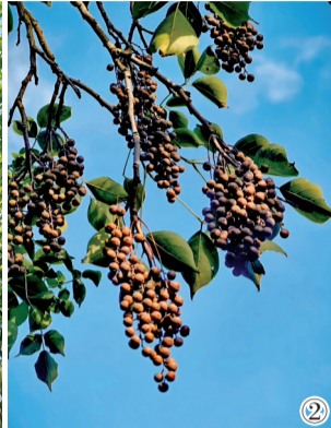
图①：武汉东湖的重阳木。 图②：重阳木的浆果。