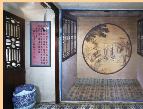
图为三希堂北间小阁西墙上的通景画。