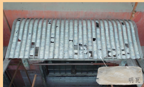
图为养心殿东暖阁后檐窗雨棚。