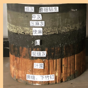
图为养心殿“一麻五灰”地仗分层示意。