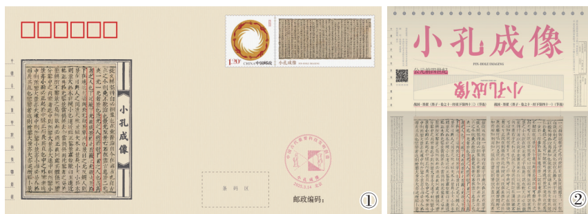
图①②：“小孔成像”纪念封及内插页。