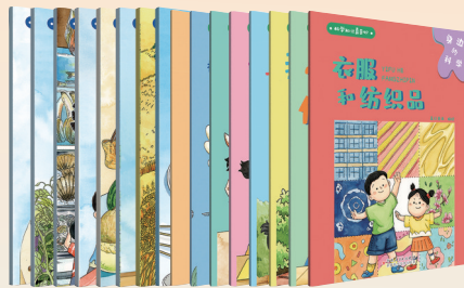
“身边的科学”丛书,蓝灯童画编绘,新疆科学技术出版社出版。

“身边的科学”是一套独具特色的科普绘本,以图文并茂的形式,从孩子的视角出发,用通俗易懂的语言,解析日常生活中常见事物及其背后的科学原理。丛书不仅巧妙回应小读者层出不穷的“为什么”,充分满足其好奇心,还鼓励孩子动手实践,在与家长的互动中深化对科学知识的理解。