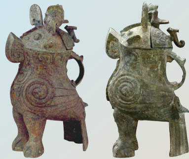
左图为中国国家博物馆馆藏妇好青铜鸮,右图为河南博物院馆藏妇好青铜鸮。