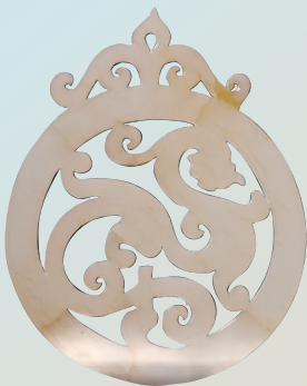
螭虎玉佩·上古神兽

展览汇聚了14家文博单位的220余件/套文物,涉及金器、壁画、石刻造像等多个类别。其中,陶俑、佛教造像等多件重要文物,首次与观众见面。