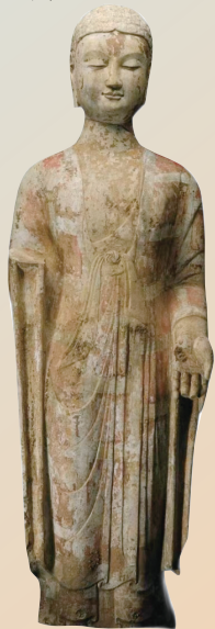
贴金彩绘石雕佛立像