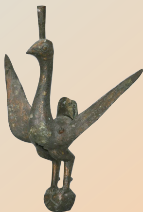
南越文王墓出土的朱雀鎏金铜顶饰

存在仅93年的南越国是一个怎样的政权?第三代君王赵婴齐有着怎样的沉浮人生?目前,“王子、质子、国王:南越明王和他的时代”在广州南越王博物院(王墓展区)展出。展览从“南越王子”“长安为质”“南越明王”“南越鸿门宴”四个部分,通过160余件/套文物,结合文献资料,以及考古发现成果,揭开南越国中期的神秘面纱。