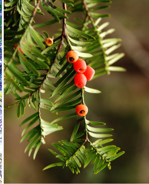
左图为东北红豆杉,右图为红豆杉的“果实”。

成为美食正是红豆杉的目的——它们热情地欢迎鸟类食用,以此传播种子。但人类对此却必须敬而远之,因为红豆杉的叶片、树皮和种子内含有剧毒物质“紫杉碱”,对大多数哺乳动物包括人类具有较强毒性。假种皮虽无害,但若误食种子,后果将不堪设想。