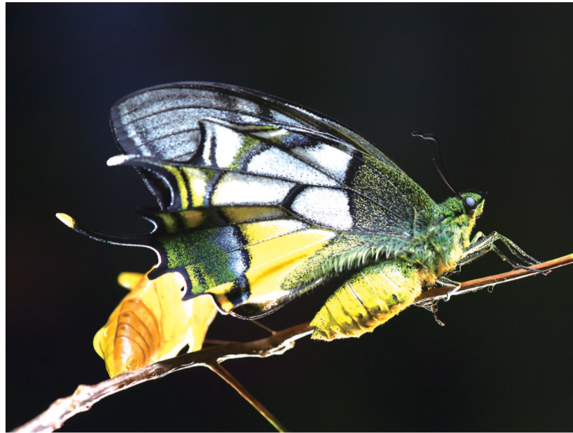
图为金斑喙凤蝶雌蝶羽化(资料图片)。

的常绿阔叶林山地，鲜少到地面进行饮水等活动，因此不易被发现和捕获。发生在一次邮票设计时的故事，也证明了它的稀缺。