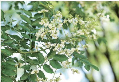
左图为刺槐花,右图为国槐花。