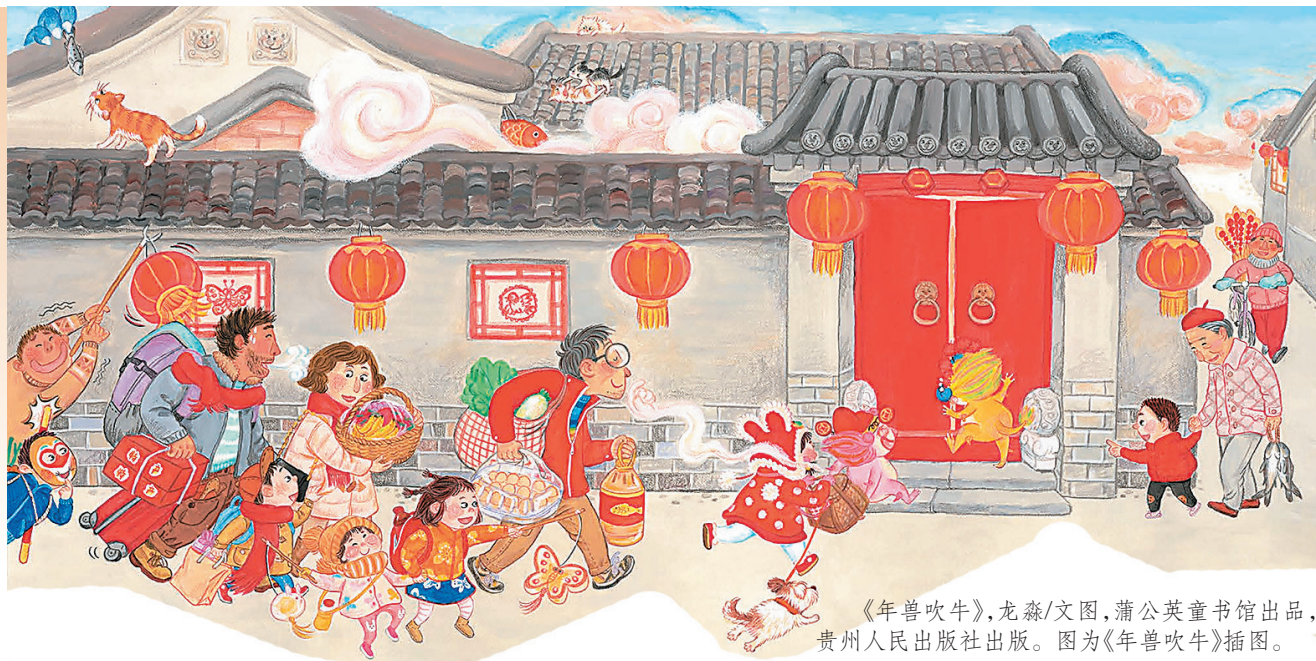
《年兽吹牛》,龙森/文图,蒲公英童书馆出品,贵州人民出版社出版。图为《年兽吹牛》插图。

编者按 春节即将到来。作为中国最重要的传统节日,春节是家人团聚、享受美食并参加各种娱乐活动的时刻。本报选取几本和春节相关的图书,希望读者们可以从书中了解春节的风俗及其背后的文化内涵,感受华夏文化的源远流长、博大精深。