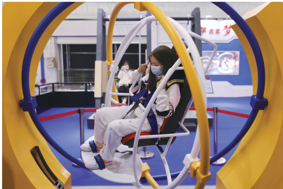
图为市民在体验宇航员训练。