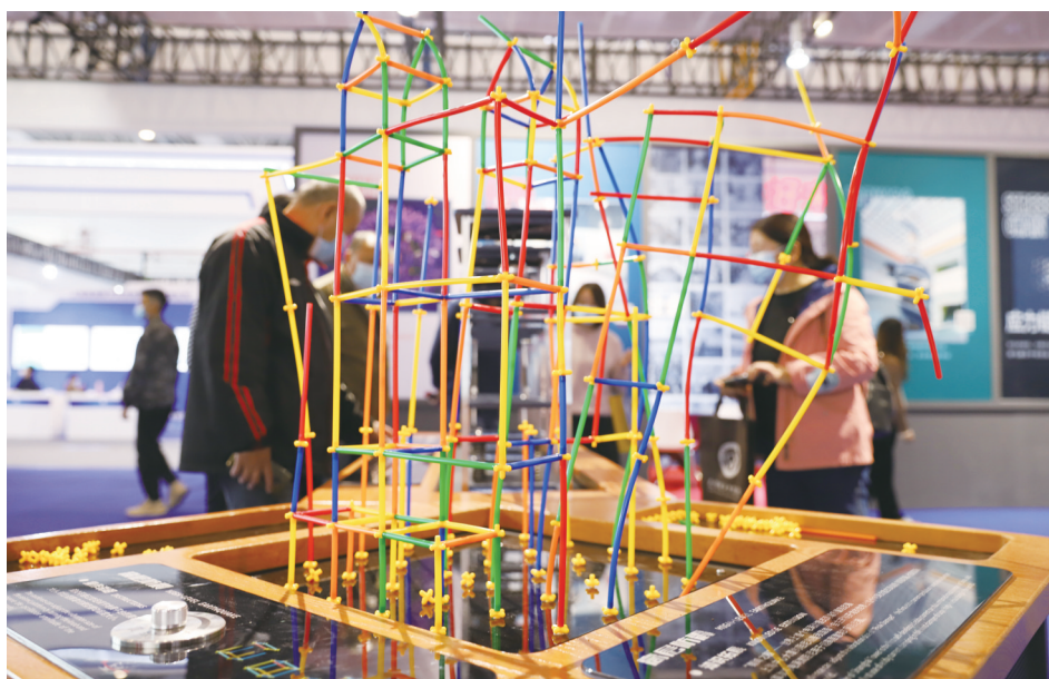
图为市民在观看高楼共振现象。