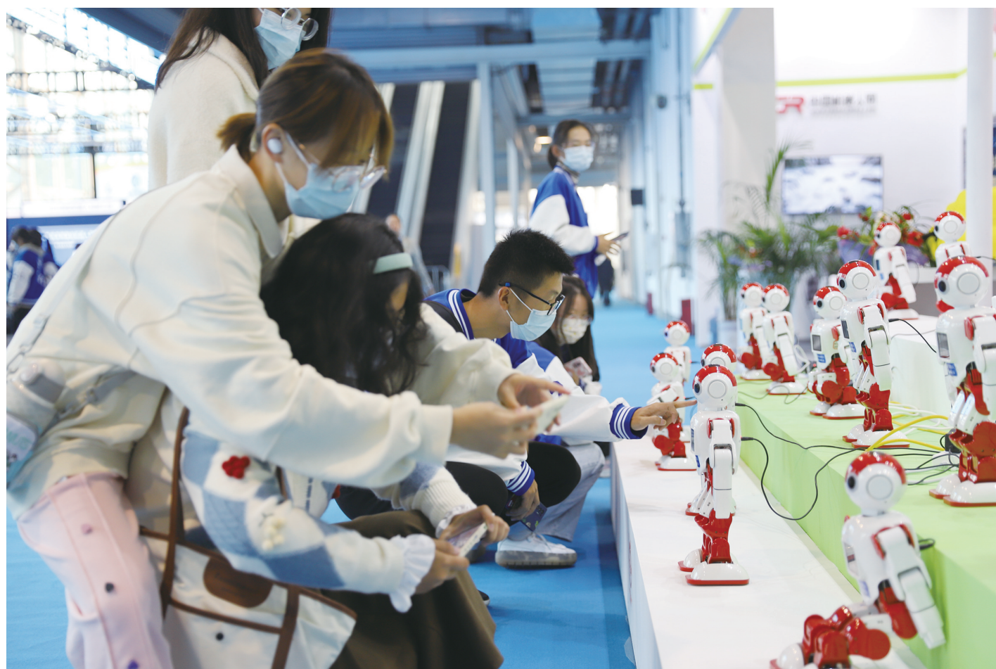
图为市民在体验机器人产品。