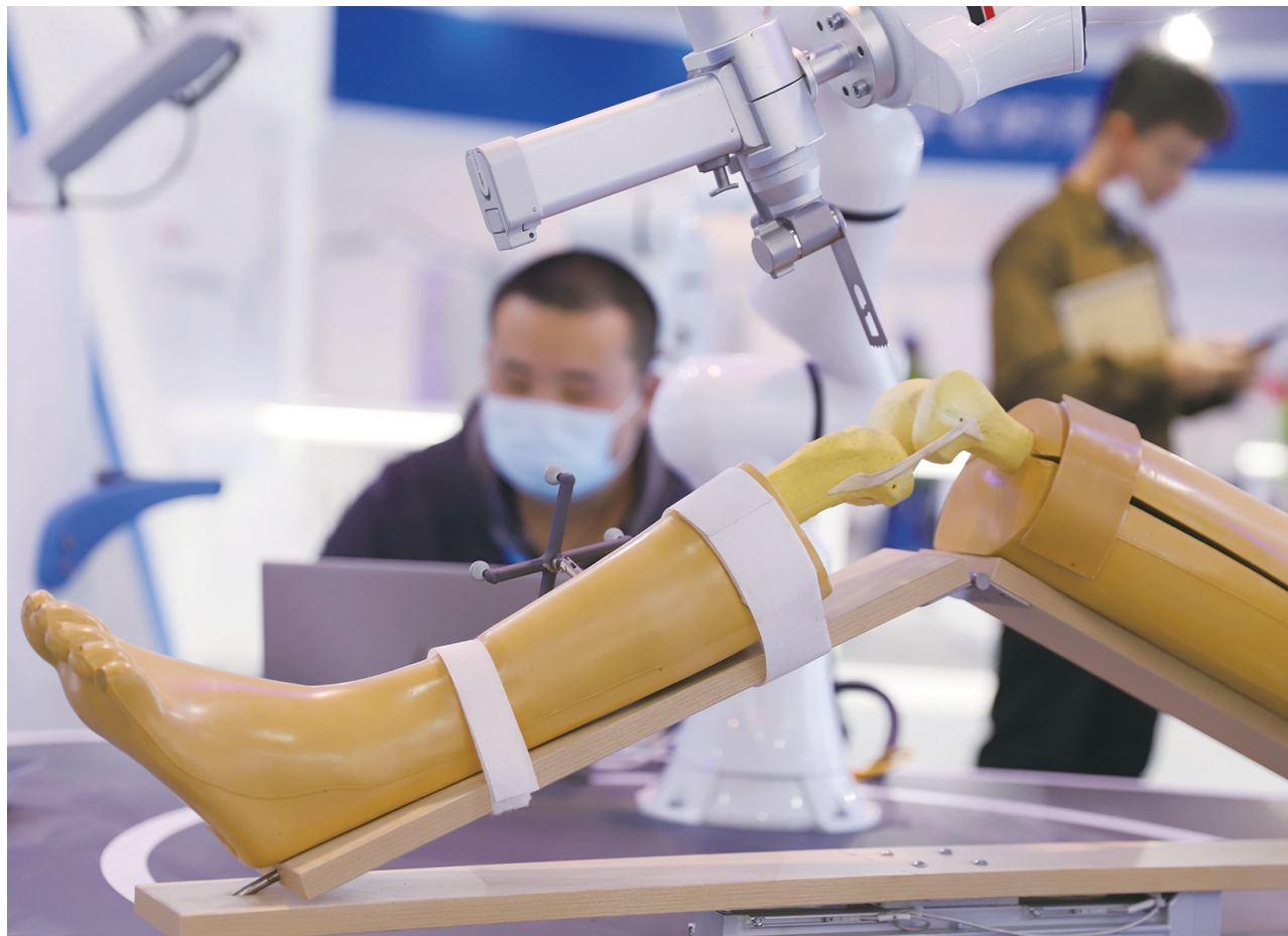
图为科博会上展出的手术机器人产品。

10月22日,第十届中国(芜湖)科普产品博览交易会在安徽芜湖宜居国际会展中心开幕。本届科博会结合重大科学事件、热点问题和经济发展,分为展览展示、论坛研讨、支撑活动三大板块,打造“线下展会、线上服务”融合发展的新场景模式,展会上各种高科技产品吸引了众多媒体和市民的关注。