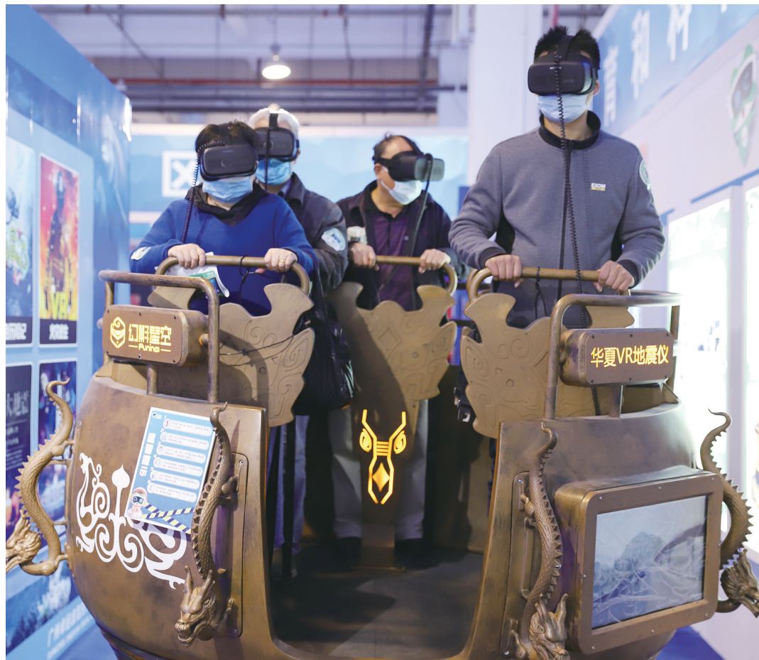
图为市民在体验地震仪。