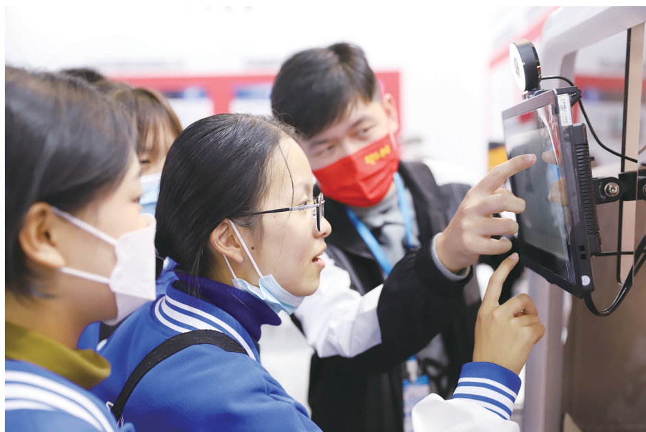
图为市民在体验拍照画像机器人。