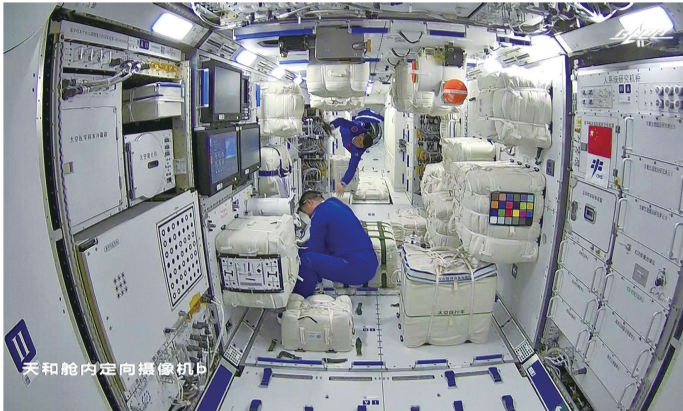
天和舱内定向摄像机B

发射成功！对接成功！入舱成功！中国航天再次吸引世界目光，6月17日，神舟十二号载人飞船顺利将聂海胜、刘伯明、汤洪波送入太空，神舟十二号与天和核心舱交会对接成功，3名航天员先后进入天和核心舱，喜讯一个接一个……回望来时路，从2003年10月15日“神五”搭载航天员杨利伟顺利升空，到如今神舟十二号升空，我国载人航天工程走过了极其不平凡的征途。如今，中国人首次进入自己的空间站，从此中国航天又开启新征程！