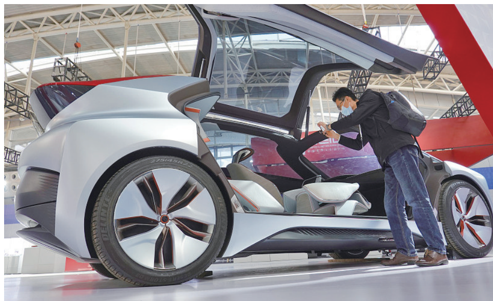
图为奔腾E2-concept新出行概念车。