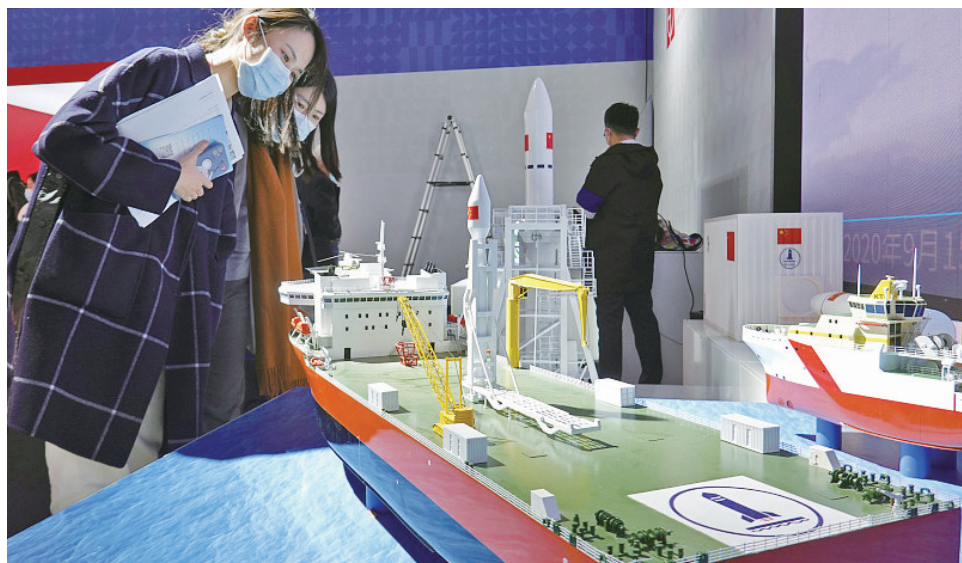
图为运载火箭海上发射系统总体设计模型。