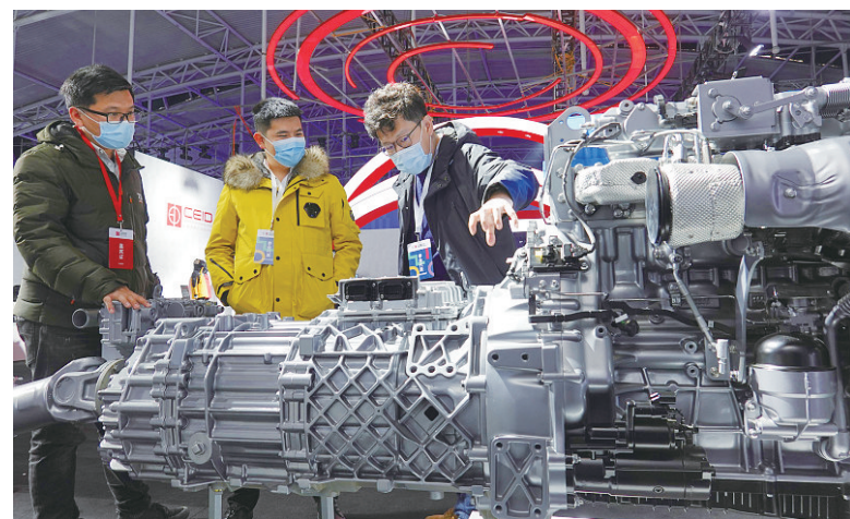
图为潍柴13G动力总成。