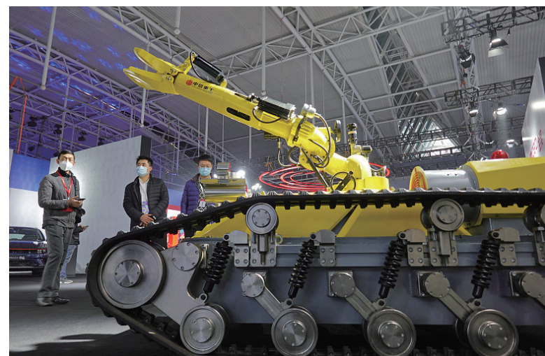
图为消防灭火侦察机器人。