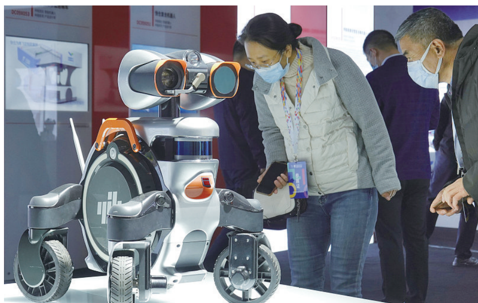
图为智能巡检机器人。