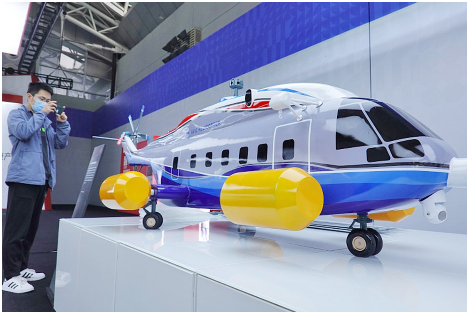
图为AC313全疆域运输直升机。

工业设计是创新链的起点,价值链的源头,是实现制造业高质量发展的重要手段,也是助力制造业企业增品种、提品质、创品牌的关键环节。近日,以“设计·智向未来”为主题的2020年世界工业设计大会在山东烟台举办。此次大会聚焦“智慧、智能、智造”三智融合,围绕工业设计与智能制造的融合、智能服务展开深度探讨,来自机械装备、智能机器人等14个领域的1000多项工业设计成果悉数亮相,尽显“创造之美”。