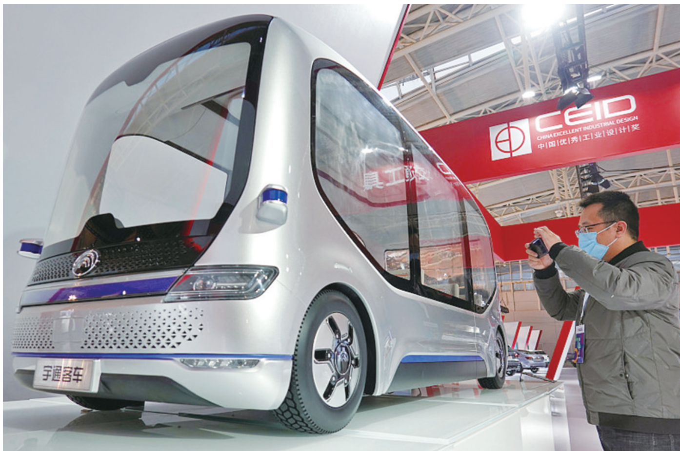
图为宇通智联自动驾驶巴士。