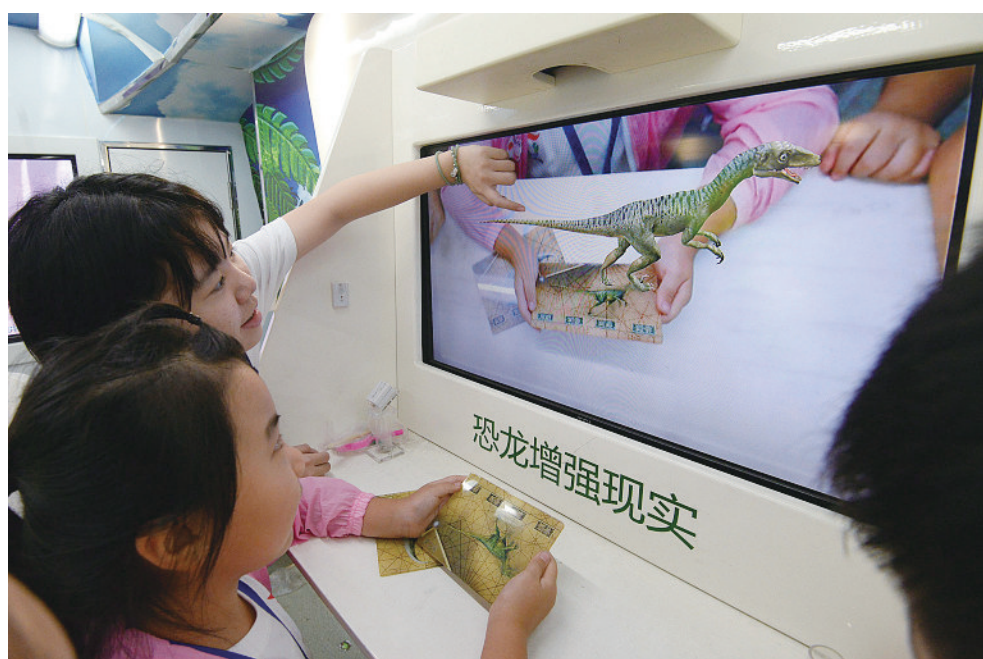
8月23日,河北邯郸,小朋友们在“流动科普车”上参观。