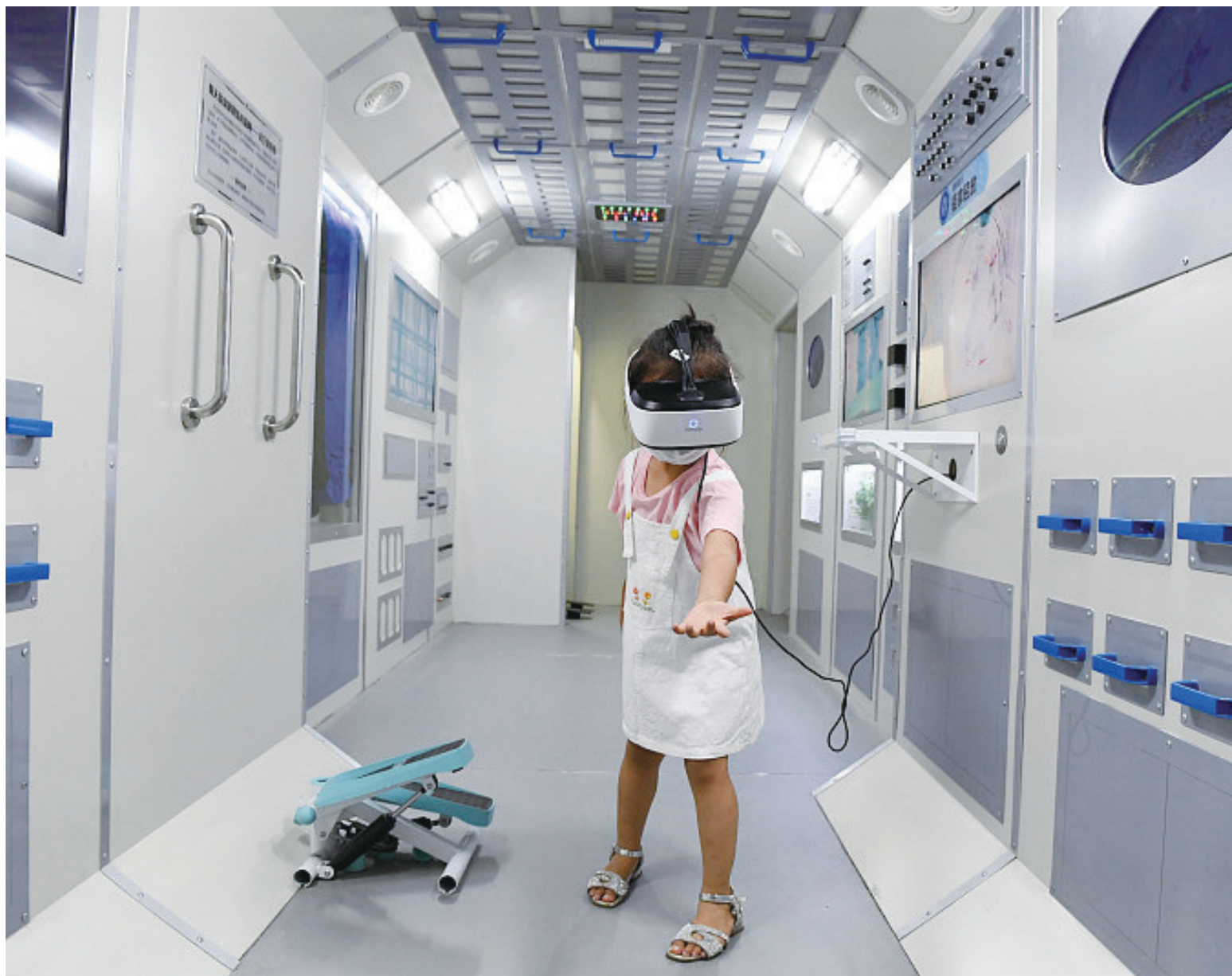
8月23日,贵州省仁怀市科技馆内,小朋友戴上VR眼镜,体验宇航员在空间站里的情景。