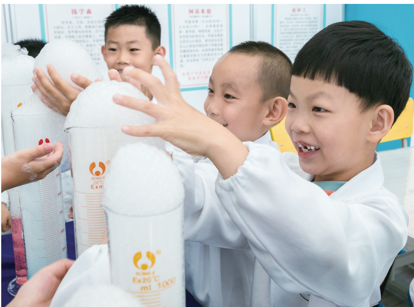
8月12日,孩子们在内蒙古呼和浩特市玉泉区青少年宫“坚果科学实验室”观察体验“干冰升华”趣味小实验。