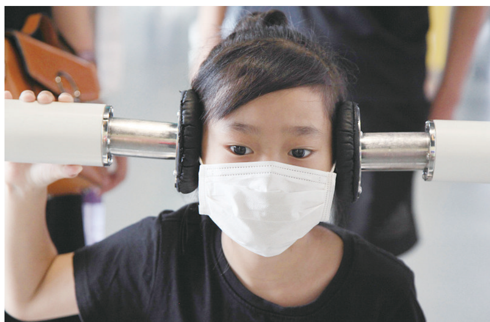
8月23日,江苏省南京市,一个小朋友在南京科技馆体验“顺风耳”装置。