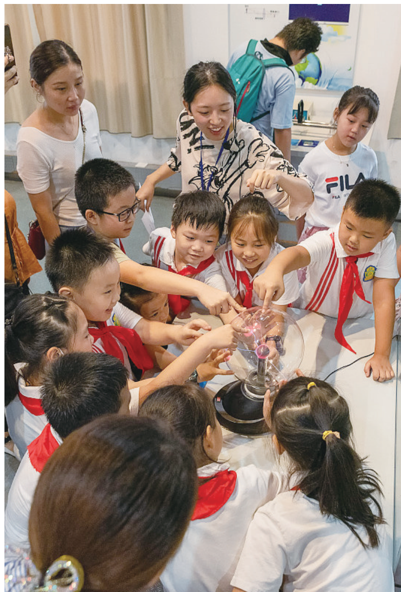
8月22日,合肥现代科技馆,安居苑小学的小朋友们在志愿者的讲解下认识学习各种科学知识。