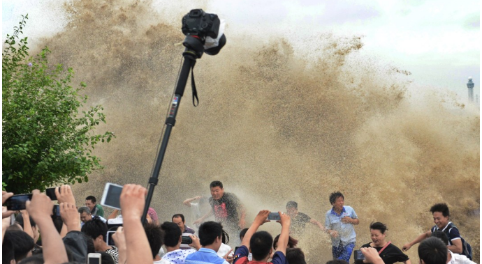
上图：钱塘江北岸远眺。下图：钱塘江涌潮时的壮观景象。