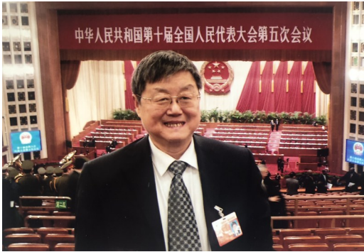
本文作者出席“两会”（2007年）

“两会”是对自1959年以来历年召开的中华人民共和国全国人民代表大会和中国人民政治协商会议的统称。由于两场会议会期基本重合，而且对于国家运作的重要程度都非常高，故简称“两会”。从省级地方到中央，各地的政协及人大的全体会议会期全都基本重合，所以，两会的名称可以同时适用于全国及各省（市、自治区）。