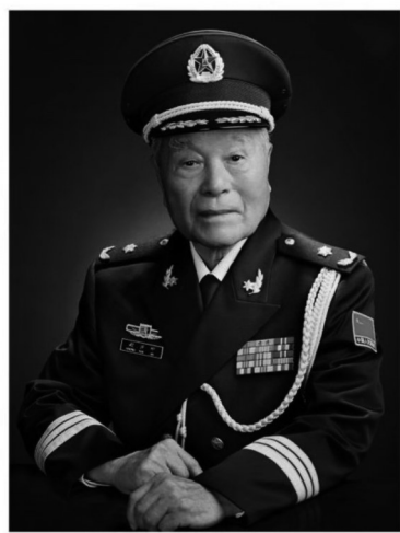
(作者系国家教育咨询委员会委员、中国科技馆馆长、研究员)