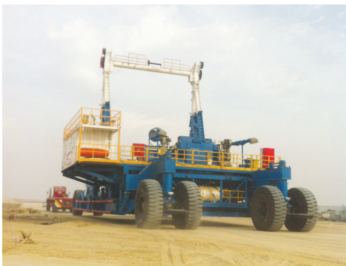
湖南钻井科威特项目井队整体搬迁