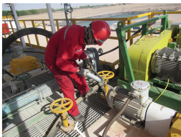
SP175井队员工进行设备保养

对于湖南钻井分公司的他们,不论是铁骨还是柔情,他们都是用实际行动来践行自己的使命感与大爱,他们更值得我们为之一点赞喝彩。