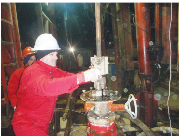
SP926井队配合第三方工程师调节抽油杆长度

好的设备才能确保安全生产,保障高的日费率。湖南钻井分公司科威特项目要求,各钻修井队要做到分工明确,责任到人,“种好责任田”,按岗位职责把相应的设备划分给每个人去管理。让每个员工做到对设备的“四懂三会”——懂原理、懂结构、懂性能、懂用途、会修理、会操作、会保养。