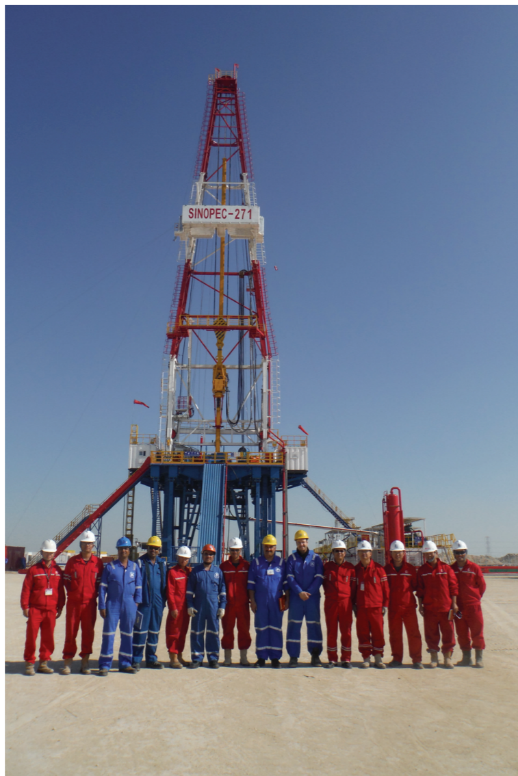
科威特SP271顺利通过开钻验收