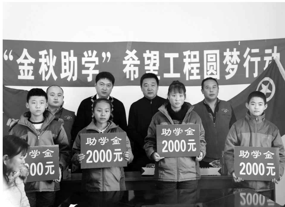
助学金发放仪式现场

活动现场,这个厂菊花爱心传递志愿者团队的志愿者科学家将提前对孩子们准备的书本文具、洗发水、洗衣液等