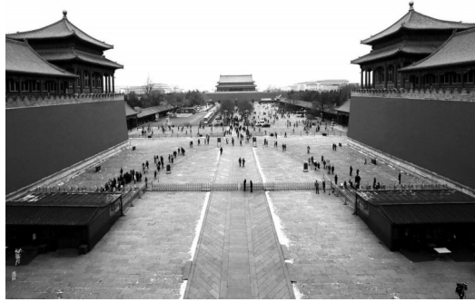
故宫午门广场环境改善后场景

今天的故宫,与5年前有很大的不同。商业化的紫禁城广场经过清理,变得清新、庄重、典雅、干干净净;30个每天全开的售票窗口,加上60%的网上预约,原先排一个多小时对才能买到票,现在不超过3分钟……进门顺畅了,标识清晰了,黑黢黢的大殿现在有了LED冷光源,既关照到了古建筑保护,又满足了参观者的意愿。曾经,诺大的紫禁城没有一个凳子,没有一个椅子,若要休息,只能席地