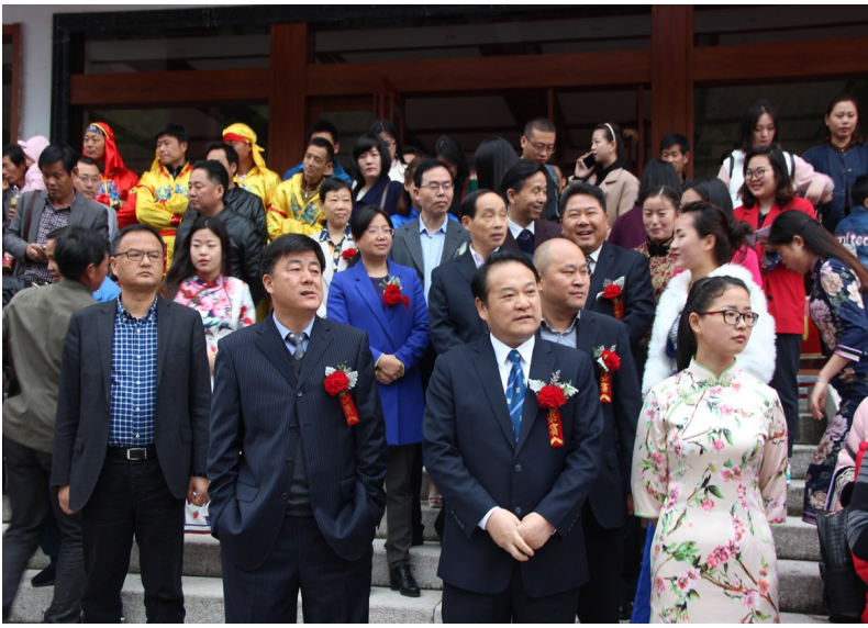
地方党政领导和嘉宾进入启动仪式会场