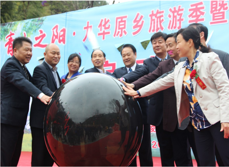
出席活动的领导和嘉宾共同按下启动球