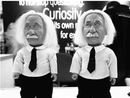
爱因斯坦教学机器人