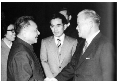
邓小平会见日本首相大平正芳