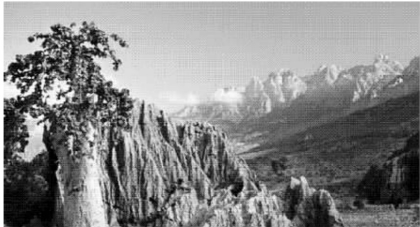
在非洲大陆蕴藏着大量的地下资源

日本首相安倍晋三13日结束对莫桑比克的访问,启程前往非洲行的最后一站埃塞俄比亚,14日他将在非盟总部发表日本对非政策的演讲。安倍访问莫桑比克期间,日莫两国达成了共同开发油气和煤炭等资源的共识。有分析称,这是安倍非洲之行获得的第一个“资源开发权”。外媒认为,安倍是8年来首位率领商务代表团出访非洲的日本首相,旨在强化具有安倍色彩的“俯瞰地球仪外交”,也有对抗崛起的中国之意。