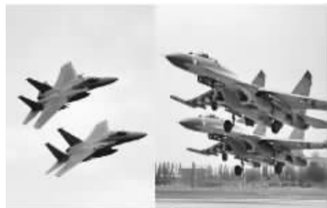
日本航空自卫队的F-15(左)和中国空军苏-30战机