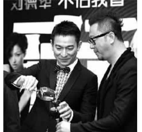
从来不喝酒 不让肝脏雪上加霜

生活中,有很多人体内虽然有乙肝病毒,却和刘德华一样不需要治疗,只需定期复查。遗憾的是,这些人并没有像刘德华一样如此认真对待定期复查。