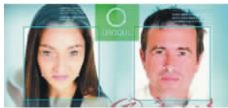
全球首个“刷脸”支付系统