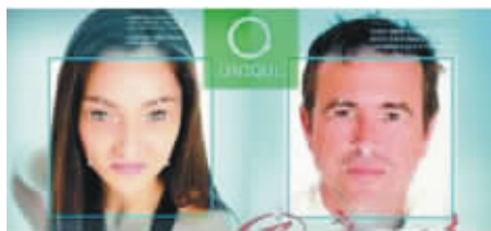
全球首个“刷脸”支付系统