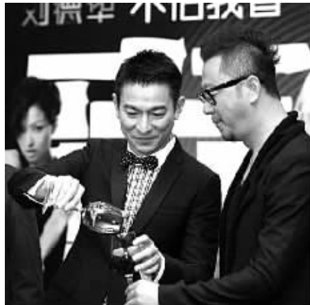
从来不喝酒 不让肝脏雪上加霜

生活中,有很多人体内虽然有乙肝病毒,却和刘德华一样不需要治疗,只需定期复查。遗憾的是,这些人并没有像刘德华一样如此认真对待定期复查。