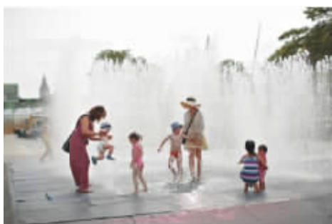
7月16日,伦敦,英国气温居高不下,民众在喷泉边玩耍降温。

据了解,30年前曾经有日本科学家在北京考察后证实,北京地区存在不下20种萤火虫,可是近些年,科学家在北京经过长时间的观测,仅在该市郊区找到一种萤火