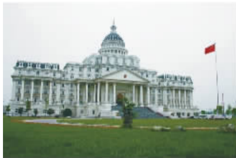
中国出台新规后,多家外媒提到安徽阜南酷似白宫的政府大楼。

美联社说,首都机场爆炸案让人们提出了这样的疑问:中国能否充分应对那些越来越边缘化的社会人群所积聚的不满和怨气,事件还暴露出中国现行司法制度无法向人们提供公平感的缺陷。有人担心,每一个在