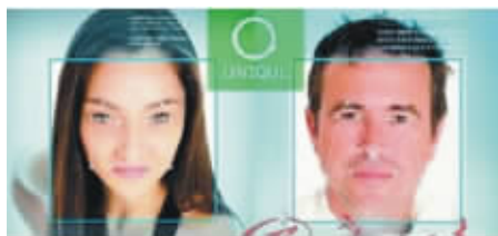
全球首个“刷脸”支付系统