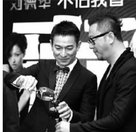
从来不喝酒 不让肝脏雪上加霜

生活中,有很多人体内虽然有乙肝病毒,却和刘德华一样不需要治疗,只需定期复查。遗憾的是,这些人并没有像刘德华一样如此认真对待定期复查。