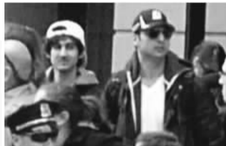
当地时间2013年4月19日凌晨,美国联邦调查局(FBI)发布波士顿爆炸案两名嫌犯在一起的正面照。