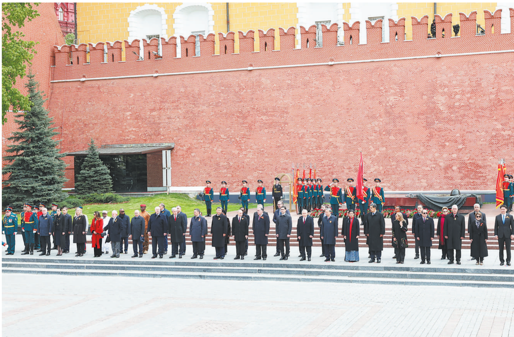
当地时间五月九日，俄罗斯举行盛大庆典，纪念苏联伟大卫国战争胜利八十周年。国家主席习近平和来自世界二十多个国家及国际组织领导人应邀出席庆典。庆典结束后，各国领导人集体合影留念。