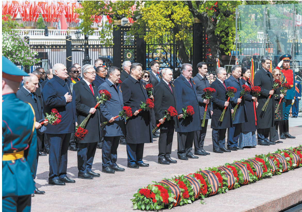
当地时间5月9日，俄罗斯举行盛大庆典，纪念苏联伟大卫国战争胜利80周年。国家主席习近平和来自世界20多个国家及国际组织领导人应邀出席庆典。庆典结束后，习近平同其他国家领导人一起从红场来到亚历山大花园，向无名烈士墓献花，并肃立默哀。