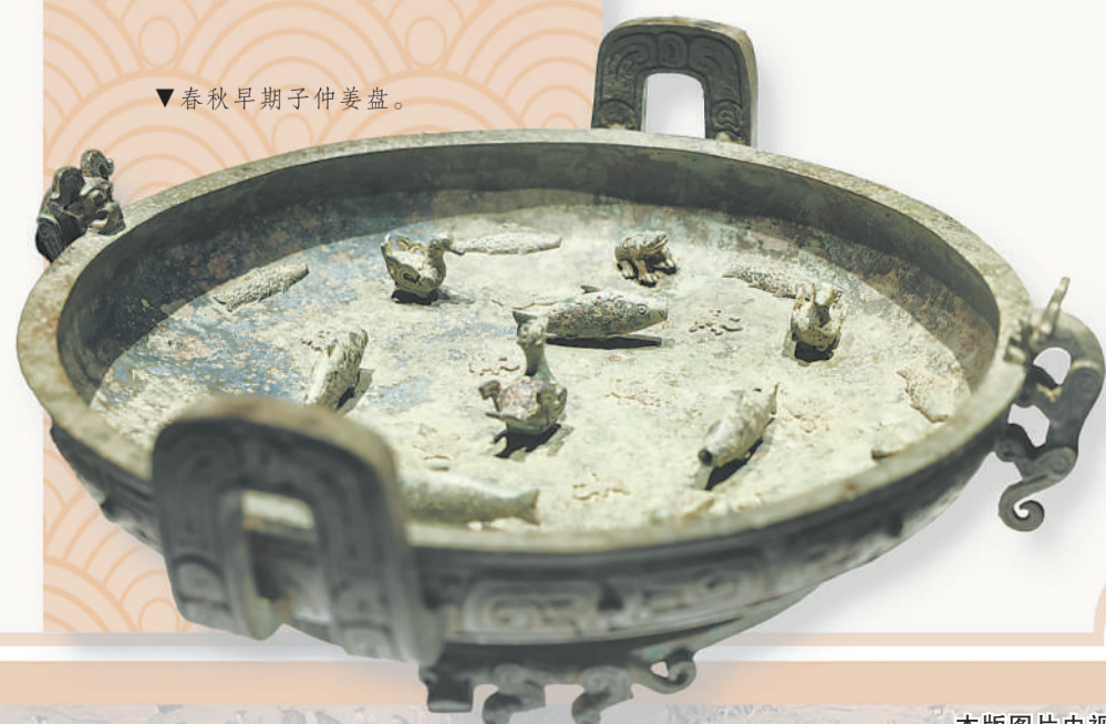
▼春秋早期子仲姜盘。