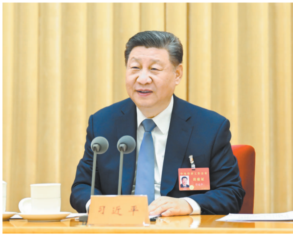
12月11日至12日，中央经济工作会议在北京举行。中共中央总书记、国家主席、中央军委主席习近平出席会议并发表重要讲话。

要实施更加积极的财政政策。提高财政赤字率，确保财政政策持续用力、更加给力。加大财政支出强度，加强重点领域保障。增加发行超长期特别国债，持续支持“两重”项目和“两新”政策实施。增加地方政府专项债券发行使用，扩大投向领域和用作项目资本金范围。优化财政支出结构，提高资金使用效益，更加重视惠民生、促消费、增后劲，兜牢基层“三保”底线。党政机关要坚