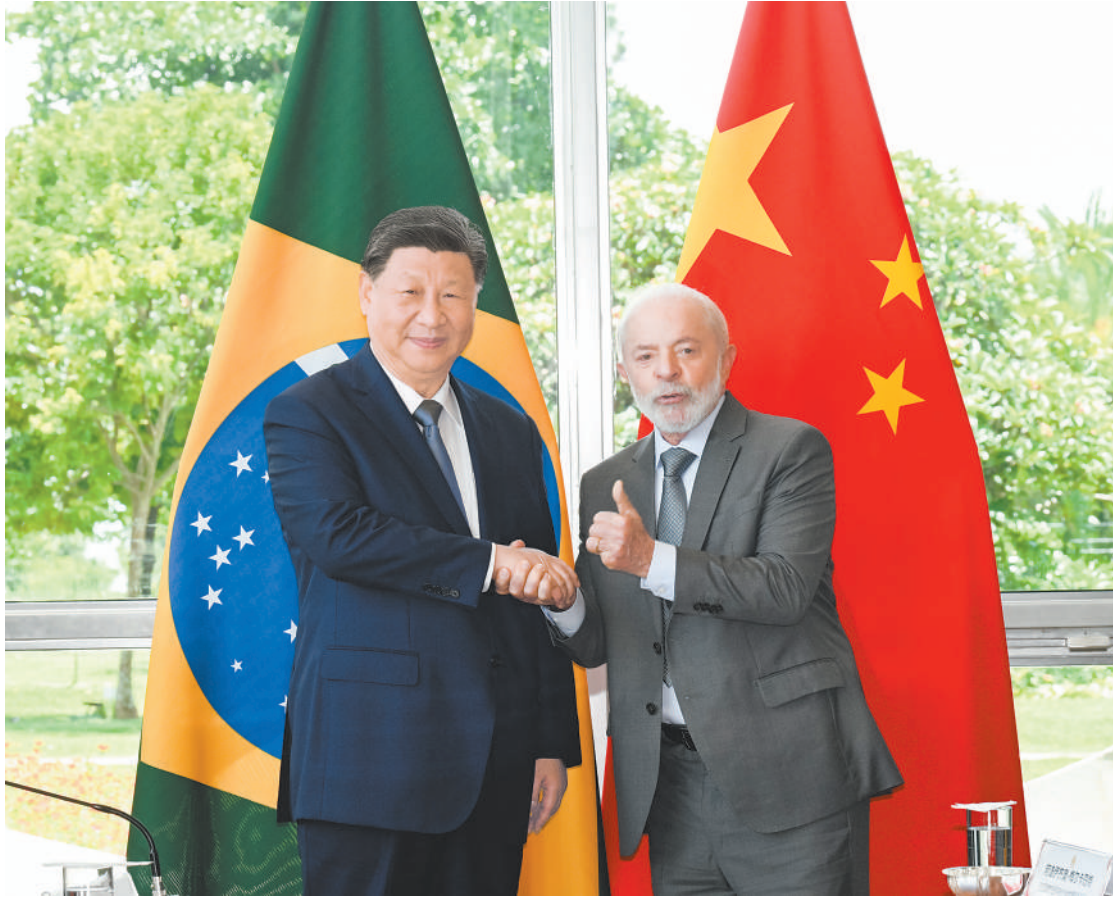
当地时间11月20日上午，国家主席习近平在巴西利亚总统官邸黎明宫同巴西总统卢拉举行会谈。