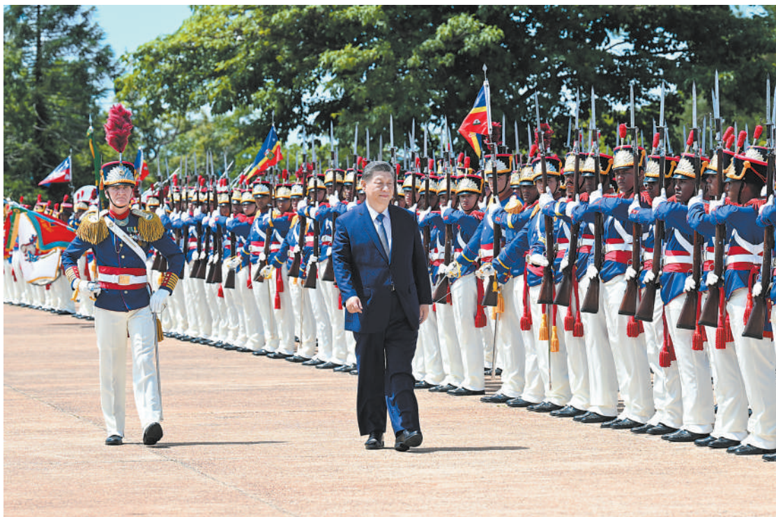
当地时间11月20日上午，国家主席习近平在巴西利亚总统官邸黎明宫同巴西总统卢拉举行会谈。会谈前，卢拉总统和夫人罗桑热拉热情迎接习近平，并为习近平举行隆重盛大欢迎仪式。

新华社巴西利亚11月20日电（记者倪四义 陈威华）当地时间11月20日上午，国家主席习近平在巴西利亚总统官邸黎明宫同巴西总统卢拉举行会谈。两国元首宣布，将中巴关系定位提升为携手构建更公正世界和更可持续星球的中巴命运共同体。 初夏时节的巴西利亚，天朗气清。黎明宫内，绿草如茵，450名威武礼兵整齐列队。在120名龙骑兵护卫下，习近平乘车抵达黎明宫前广场。 卢拉总统和夫人罗桑热拉热情迎接习近平，并为习近平举行隆重盛大欢迎仪式。 军乐团奏中巴两国国歌。两国元首一同观看仪仗队分列式。中巴儿童挥舞两国国旗热烈欢迎习近平。巴西艺术家用中文演唱《我的祖国》。 两国元首分别同对方陪同人员握手致意。 欢迎仪式后，两国元首举行会谈。 习近平指出，很高兴在中巴建交50周年这个具有重要历史意义的年份访问巴西。刚才卢拉总统为我举行最高礼遇的隆重欢迎仪式，充分体现了对中巴关系的高度重视以及对中国人民的深情厚谊，令我深受感动。中国和巴西是东西半球两大发展中国家的友好邻邦，共同发展的历史机遇，深化经贸、基础设施、金融、科技、环保等重点领域合作，加强航天、农业科技、清洁能源等领域合作。中方把脱贫攻坚摆在治国理政的突出位置，支持巴方“零饥饿”计划，愿同巴方继续加强减贫合作，让两国人民过上更美好生活。 三是担当与共，为维护世界和平和正义展现中巴力量。践行真正的多边主义，坚持公道正派、办公道事，推动全球治理朝着更加公正合理的方向发展。中方高度重视巴西的国际地位和影响力，支持巴西在国际舞台上发挥更