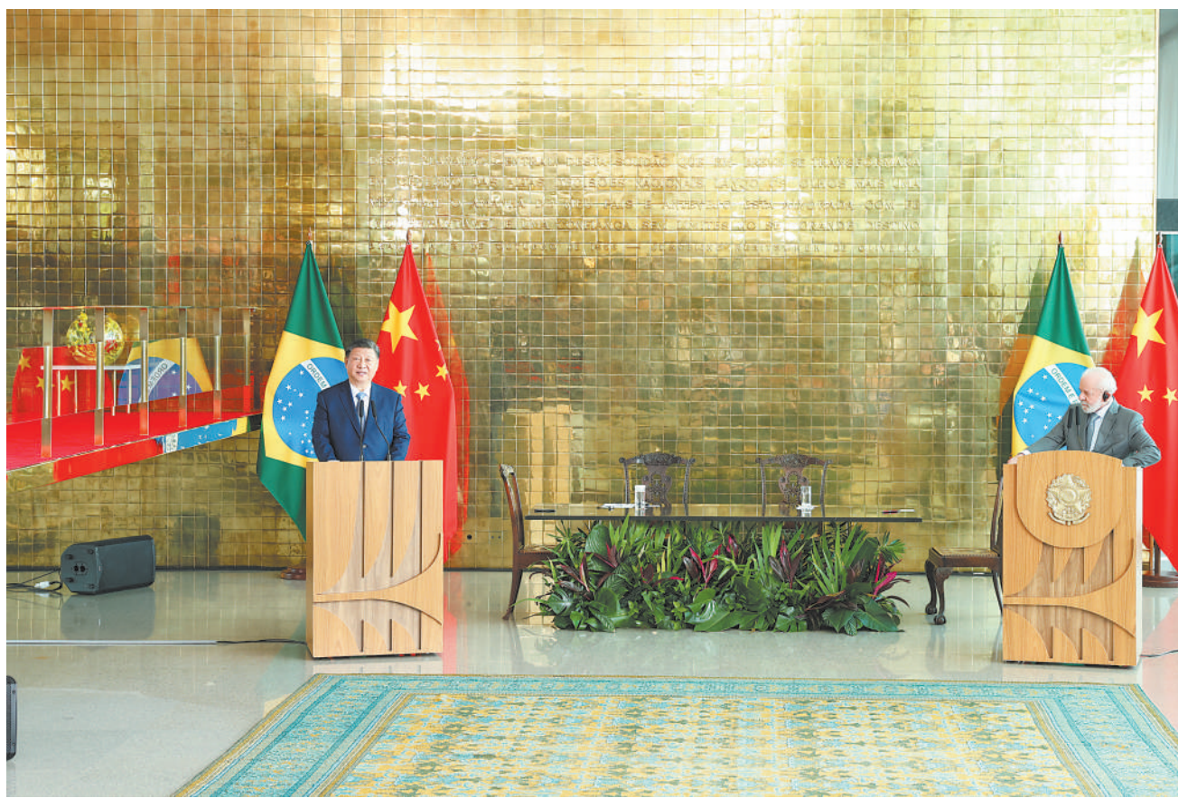
当地时间11月20日上午，国家主席习近平同巴西总统卢拉在巴西利亚总统官邸黎明宫会谈后共同会见记者。

新华社巴西利亚11月20日电（记者杨依军 周永穗）当地时间11月20日上午，国家主席习近平同巴西总统卢拉在巴西利亚总统官邸黎明宫会谈后共同会见记者。 习近平指出，这是我时隔5年再次踏上这片“充满爱和希望的土地”。启程前夕，我收到多封巴西各界友好人士的来信，信中洋溢着巴西人民对巴中友谊的珍视和对深化两国友好的期