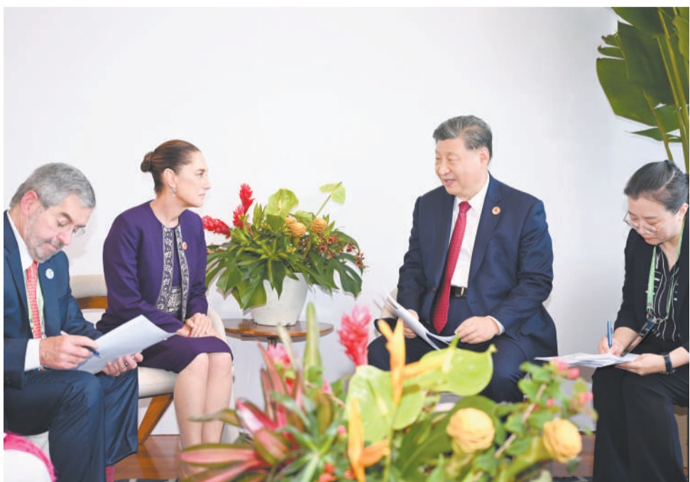
当地时间11月18日下午,国家主席习近平在里约热内卢出席二十国集团领导人峰会期间会见墨西哥总统辛鲍姆。

新华社里约热内卢11月18日电 (记者乔继红 廖思维)当地时间11月18日下午,国家主席习近平在里约热内卢出席二十国集团领导人峰会期间会见墨西哥总统辛鲍姆。 习近平再次祝贺辛鲍姆成为墨西哥历史上首位女性总统。习近平指出,2013年我曾访问墨西哥,留下了深刻而难忘的印象。中墨两国有着悠久友好传统,双方应不断增进交往,赓续友谊,用好两国经济的高度互补性,不断推进务实合作,推动两国关系在新时期得到全方位发展。中墨两国对很多国际问题的看法相似,理念契合,都倡导普惠包容的经济全球化。中方愿同墨方一道,维护多边主义和国际公平正义,为推动世界经济发展注入正能量。 辛鲍姆表示,很高兴结识习近平主席,我完全赞同您对我们两国关系的评价。中墨两国虽然相距遥远,但联系十分密切。很多中国企业在墨西哥开展业务,包括参与墨西哥城重要基础设施项目建设。感谢中方在墨西哥遭遇飓风等困难时刻给予大力真诚帮助,这是