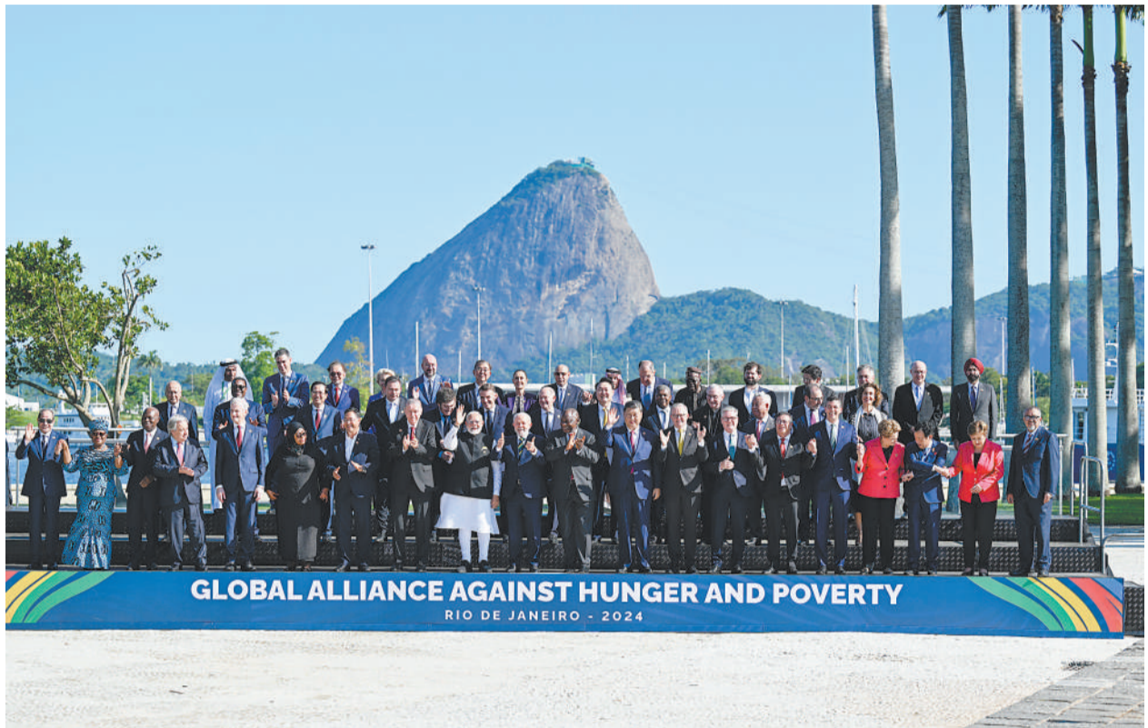
当地时间11月18日上午,国家主席习近平在巴西里约热内卢出席二十国集团领导人第十九次峰会。峰会把“构建公正的世界和可持续发展的星球”作为主题,并决定成立“抗击饥饿与贫困全球联盟”。这是习近平同与会领导人共同参加巴方发起的“抗击饥饿与贫困全球联盟”合影。