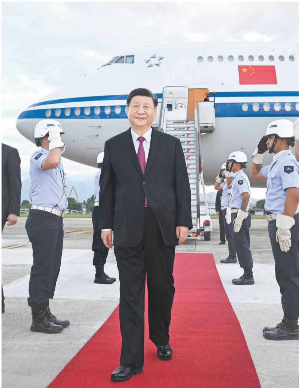
当地时间11月17日下午，国家主席习近平乘专机抵达里约热内卢，应巴西联邦共和国总统卢拉邀请，出席二十国集团领导人第十九次峰会并对巴西进行国事访问。