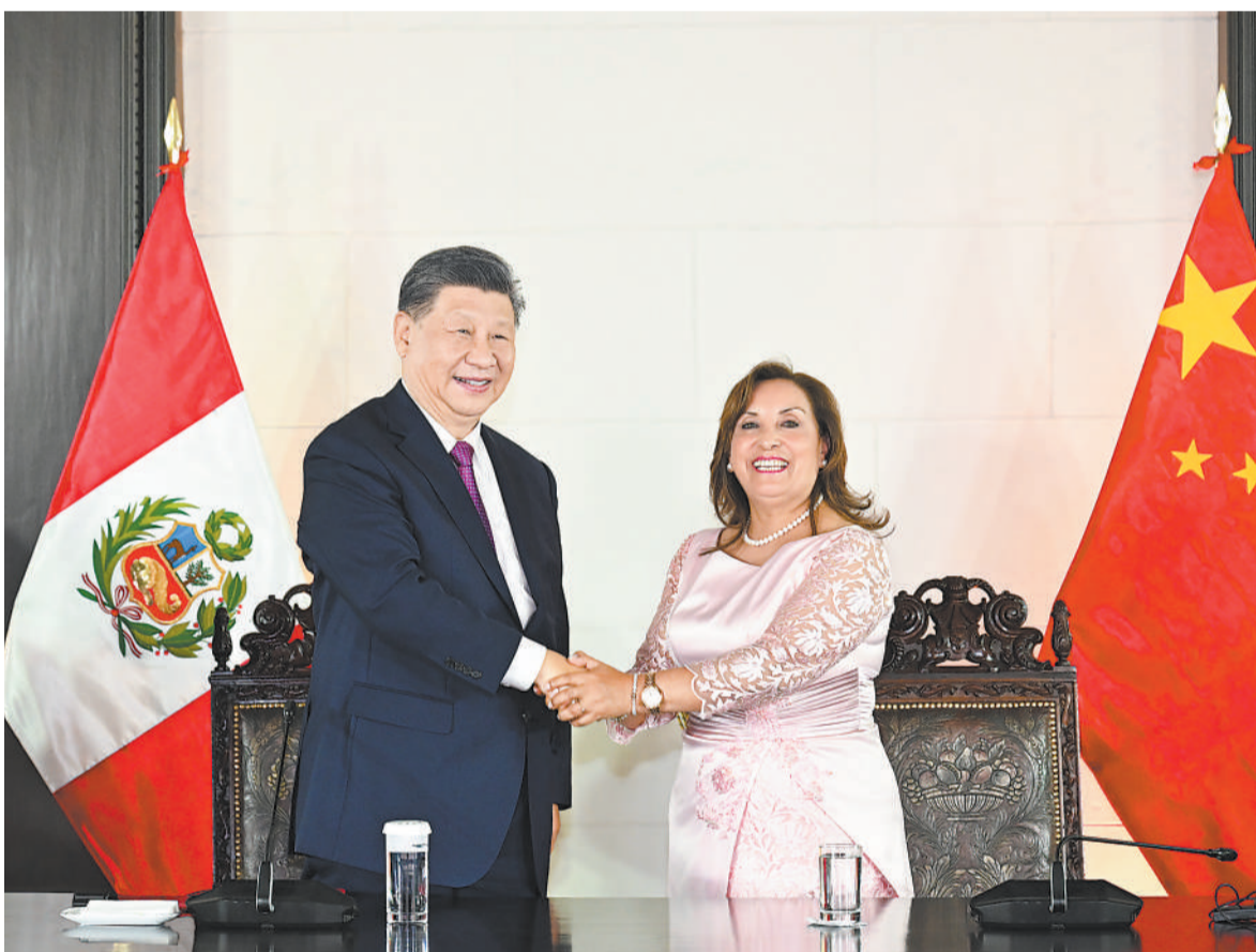
当地时间11月14日晚，国家主席习近平同秘鲁总统博鲁阿尔特在利马总统府以视频方式共同出席钱凯港开港仪式。