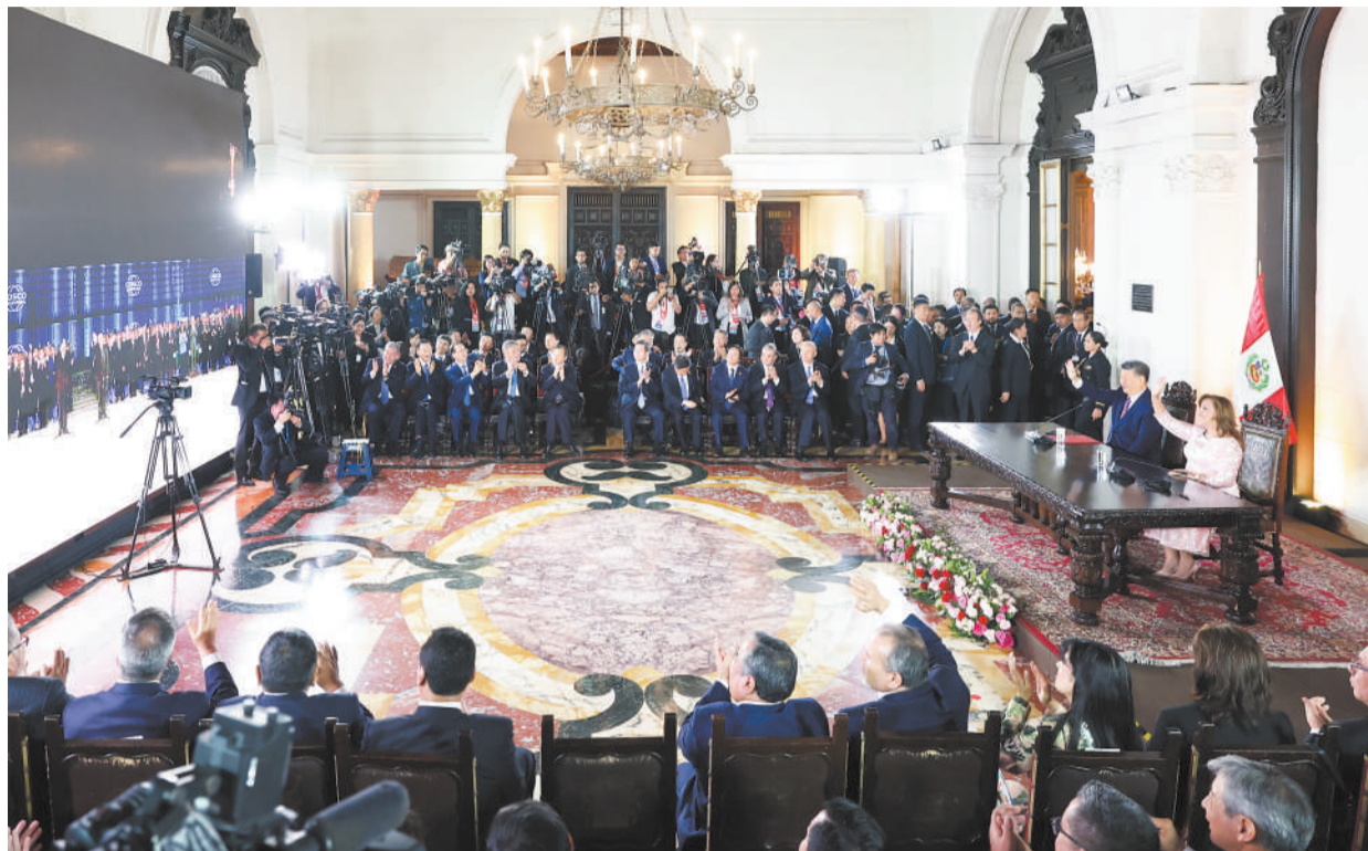
当地时间11月14日晚，国家主席习近平同秘鲁总统博鲁阿尔特在利马总统府以视频方式共同出席钱凯港开港仪式。