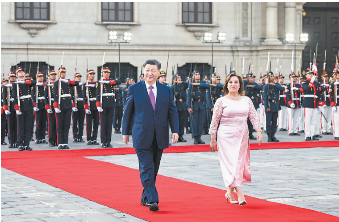
当地时间11月14日下午，国家主席习近平在利马总统府同秘鲁总统博鲁阿尔特举行会谈。博鲁阿尔特在总统府前广场为习近平举行隆重盛大欢迎仪式。