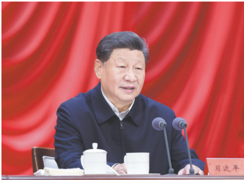
10月29日，省部级主要领导干部学习贯彻党的二十届三中全会精神专题研讨班在中央党校（国家行政学院）开班。中共中央总书记、国家主席、中央军委主席习近平在开班式上发表重要讲话。

新华社北京10月29日电 省部级主要领导干部学习贯彻党的二十届三中全会精神专题研讨班29日上午在中央党校（国家行政学院）开班。中共中央总书记、国家主席、中央军委主席习近平在开班式上发表重要讲话强调，要把学习贯彻党的二十届三中全会精神不断引向深入，引导全党全国人民坚定改革信心，更好凝心聚力推动改革行稳致远。 中共中央政治局常委李强主持开班式，中共中央政治局常委赵乐际、王沪宁、蔡奇、丁薛祥、李希、国家副主席韩正出席开班式。 习近平指出，党的十八届三中全会开启了新时代全面深化改革、系统整体设计推进改革新征程，开创了我国改革开放全新局面，具有划时代意义。新时代全面深化改革取得了重大实践成果、制度成果、理论成果，是我国改革开放历史进程中最壮丽的篇章之一，为全面建成小康社会、续写“两大奇迹”提供了强大动力和制度保障，也为新征程进一步全面深化改革提供了坚实基础和宝贵经验。 习近平强调，守正创新是进一步全面深化改革必须牢牢把握、始终坚守的重大原则。我们的改革是有方向、有原则的。坚持党的全面领导、坚持马克思主义、坚持中国特色社会主义、坚持人民民主专政，以促进社会公平正义、增进人民福祉为出发点和落脚点，这些都是管根本、管方向、管长远的，体现党的性质和宗旨，符合我国国情，符合人民根本利益，任何时候任何情况下都不能有丝毫动摇。要坚持继续完善和发展中国特色社会主义制度、推进国家治理体系和治理能力现代化的改革总目标，始终朝着总目标指引的方向前进，该改的坚决改，