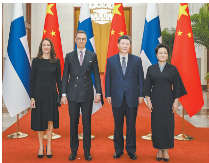
10月29日下午，国家主席习近平在北京人民大会堂同芬兰总统斯图布举行会谈。这是会谈前，习近平和夫人彭丽媛同斯图布和夫人苏珊娜合影。